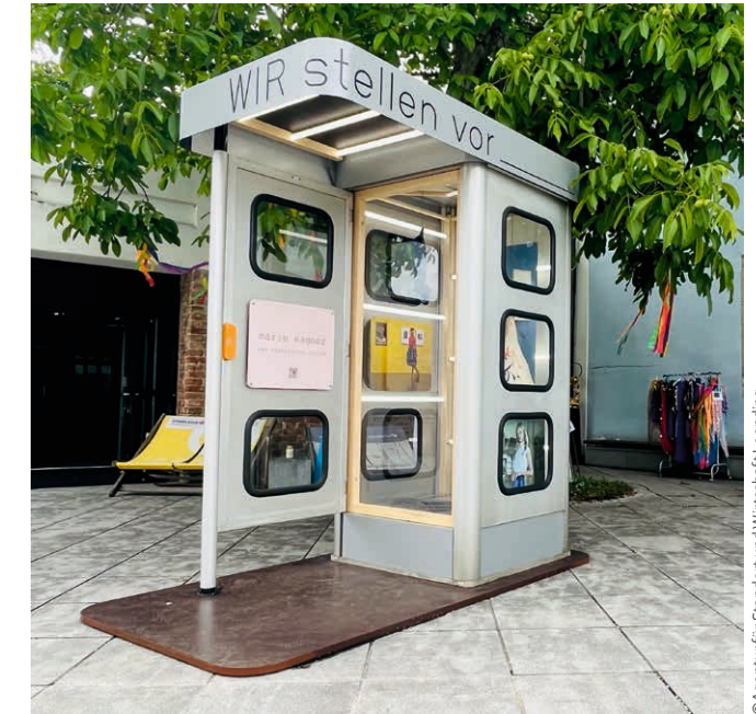
SHOW-Projekt: WIR stellen vor — Kreativer Präsentationsraum „Telefonzelle“ vor dem 44er Haus Pilotphase mit 4 Aussteller:innen durchgeführt im Sommer/Herbst 2022