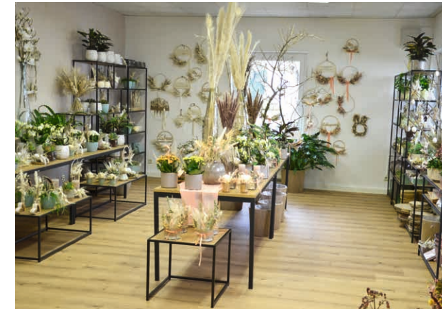
Blumenladen Blütenboutique Verena Zoitl: Gewerbegasse 5a