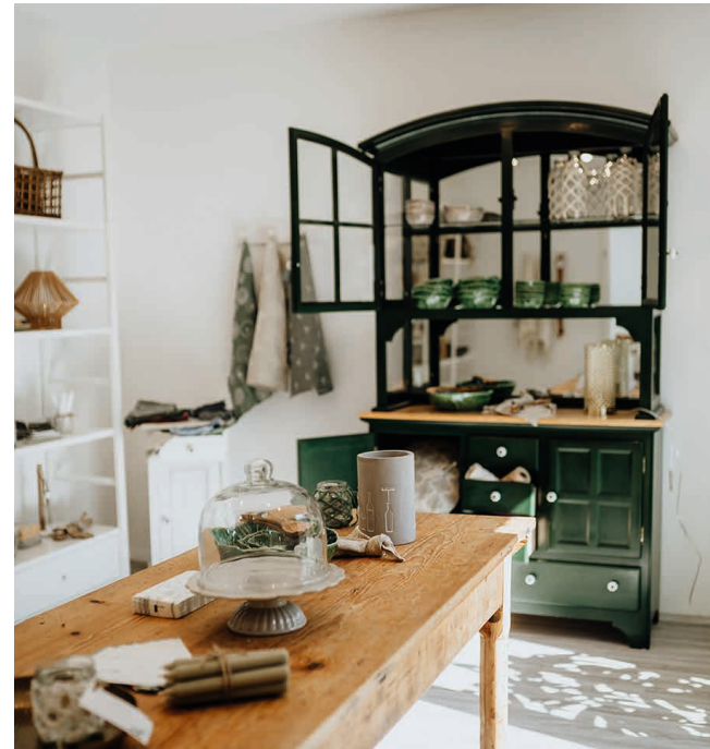
Conceptstore mit Café Carophie: Mayrhansenstraße 3